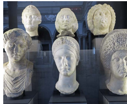
Salle Carthage Ouest, portraits